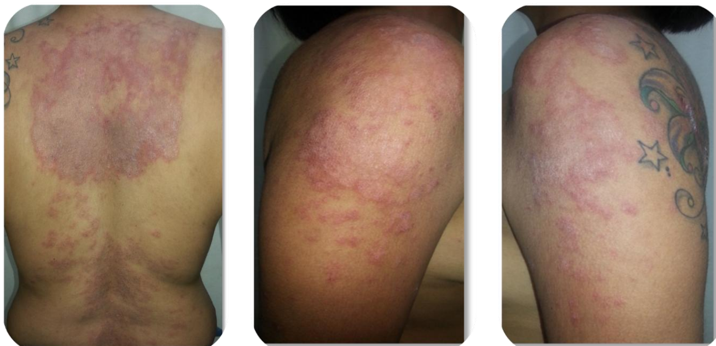
Figura 4. En su control posterior se observa un empeoramiento de las lesiones. Dichas placas se aprecian de un color heterogéneo de fondo eritematoso, superficie más blanquecina, de bordes definidos, de forma irregular, engrosadas.