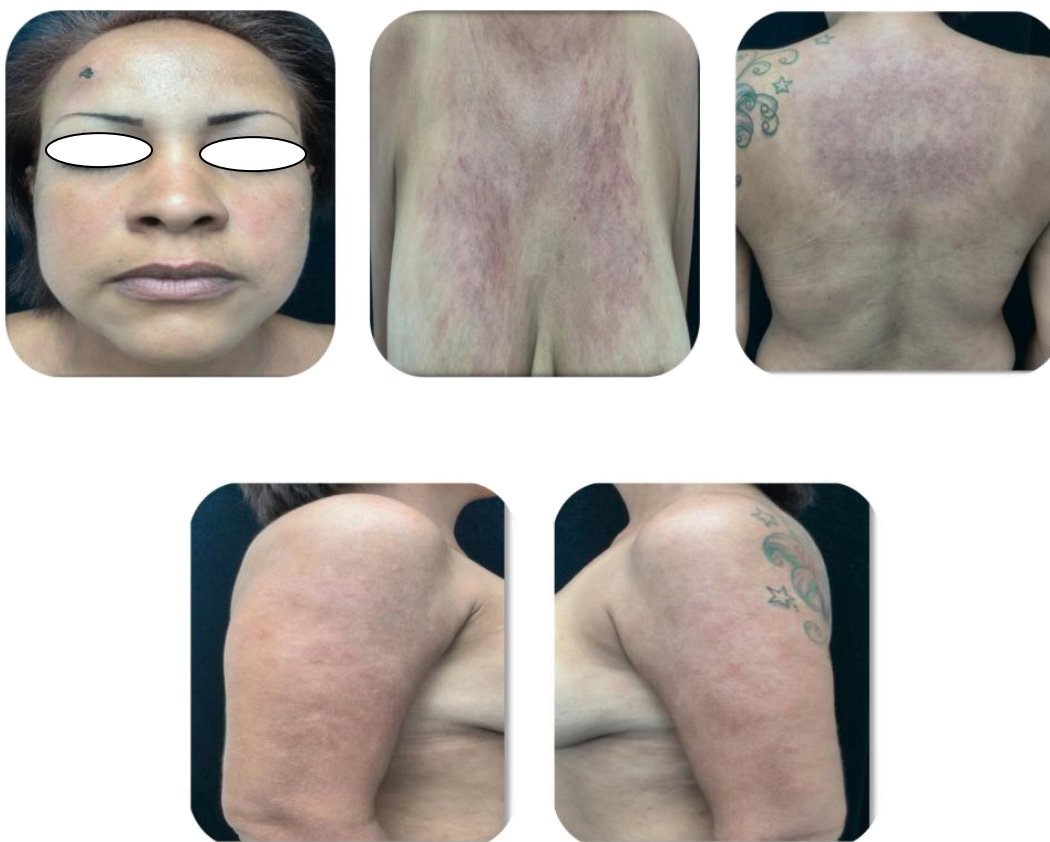
Figura 1. Múltiples placas eritematosas, de bordes definidos, de forma irregular, superficie rugosa ubicada en cara, pecho, parte superior de la espalda y brazos.

perivascular tanto en la dermis superior (Figura 2). como alrededor de las glándulas sebácea