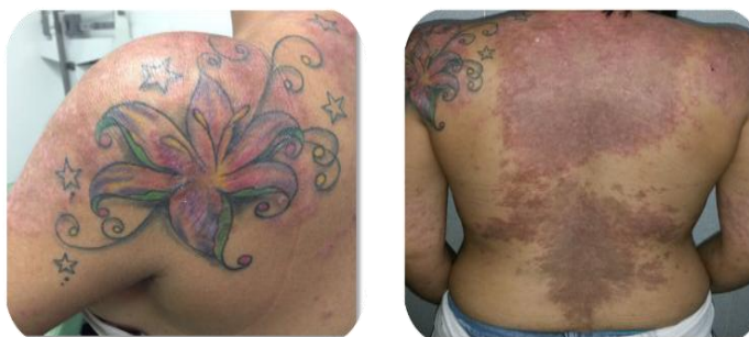
Figura 5. En la actualidad la paciente presenta placas eritematosas, de bordes definidos, de forma y tamaños variados, que se han propagado a labios, espalda, brazos, pecho, abdomen, y zonas de cicatrización de los tatuajes de hombro y cejas.

Al examen clínico intrabucal se observaron (Figura 6):