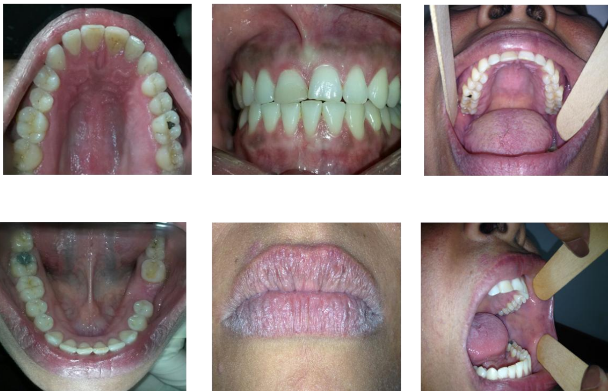
Figura 6. Múltiples maculas parduzcas, de forma irregular, bordes definidos, superficie lisa, ubicadas en encía adherida en sector anterosuperior, correspondiente a melanosis raciales o fisiológicas. Descamación y fisuración tanto del labio superior como inferior. La mucosa bucal se evalúa poco húmeda, con pérdida de su brillo característico.

Síndrome de Sjögren, el plan diagnóstico exámenes: