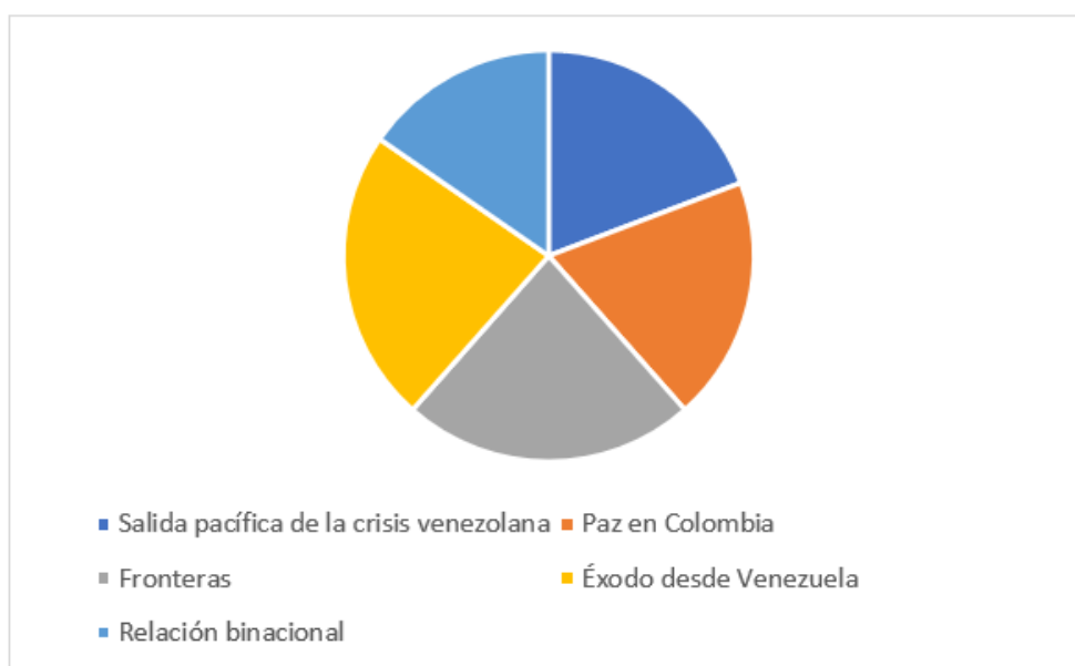
Gráfico N° 1. Presentaciones por ejes temáticos PCCV 2020