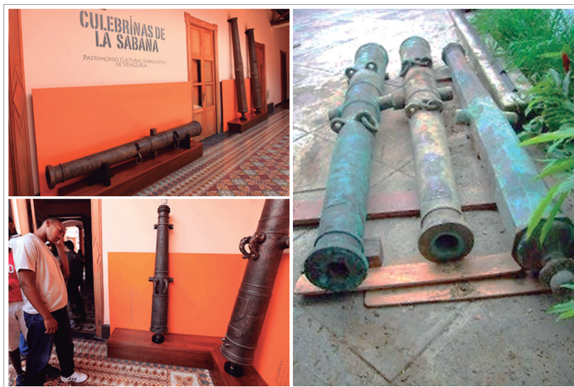
Figura 3. Culebrinas recuperadas y exhibidas en el Instituto de Patrimonio Cultural.

torno a un pequeño grupo de las culebrinas del pecio La Sabana, que a finales de 2006 llegaron a sustraerse del lugar. Según varios entrevistados integrantes de la comunidad, se habrían robado más de seis piezas, algunas de las cuales fueron recuperadas gracias a la acción ejecutada por el ente rector de los asuntos patrimoniales del país. Otros señalan que, aparte de las recuperadas, se vendieron más de tres; incluso, que estas últimas se habrían comercializado en la cercana isla de Curazao. Al final, las culebrinas rescatadas fueron objeto de un proceso de activación patrimonial lejos de su contexto espacial de hallazgo, exhibiéndose en la ciudad capital de Caracas (figura 3). 3