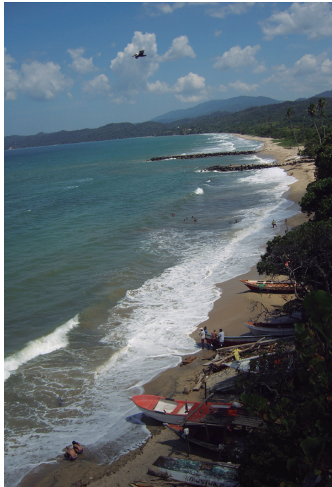
Figura 2. Vista de la extensa playa de La Sabana en donde se encuentra el pecio.

cuando se encuentran muy próximas, inmersas a unos seiscientos metros de la orilla, nadie había intentado extraerlas en ningún momento (figura 2). No obstante, la situación cambiaría en 2006, cuando unos pescadores foráneos conocieron el pecio. De inmediato, estos individuos comenzaron a buscar la manera de sustraer las culebrinas para venderlas ilegalmente y al mejor postor, asunto que lograrían, en parte. Desde entonces, el pecio La Sabana comenzó a tener relevancia fuera de las fronteras locales, involucrándose antropólogos, instituciones públicas con competencias en patrimonio cultural, algunos militares de la Armada Nacional y la propia comunidad de La Sabana.