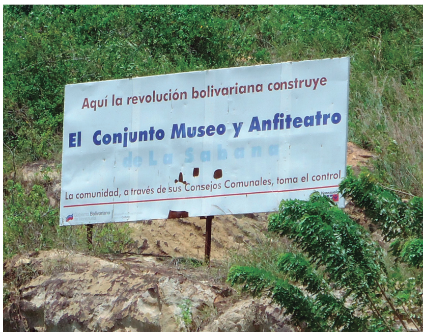
Figura 4: Cartel colocado por el IPC anunciando la construcción del museo. El nombre La Sabana ya se observa borroso, siendo un perfil tomado en 2010.

comunidad. De la valla, hoy sólo se aprecian algunas letras