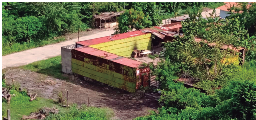
Figura 6. Los vagones convertidos en vivienda.

de las políticas públicas patrimoniales, las expectativas, saberes, ambiciones y necesidades de los demás actores involucrados quedarían subordinados a las decisiones del ente rector (Vargas y Gassón, 2010). De este modo se estarían definiendo no sólo los referentes dignos de patrimonialización, sino cómo debe concretarse su activación, imponiendo también a quién le pertenece el patrimonio. Resulta evidente que los habitantes de La Sabana fueron despojados de su derecho a conservar, usufructuar y otorgarle significado a las culebrinas. Se trata así de ejemplos que permiten comprender el sentido de las activaciones patrimoniales en Venezuela. Los actores sociales deben –entonces– lidiar con las pretensiones hegemónicas y totalitarias de las actuaciones de un Estado que, aun cuando se autodefine “progresista”, continúa motorizando los valores epistemológicos moderno-occidentales. En esos vagones observados en la figura 5, actualmente residen familias desplazadas, producto de la crisis social y económica experimentada desde el año 2012, al menos. Véase el aspecto de los vagones hoy, en la figura 6.