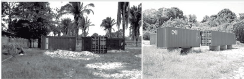
Figura 5. Izquierda: vagones (furgones de hierro) colocados por el IPC en el municipio Pedraza. Fuente: Vargas y Gassón, 2010. Derecha: los mismos vagones ubicados en la comunidad La Sabana del estado Vargas. Foto: Yara Altez, 2010.

Sabana, previo conocimiento de la presencia de importantes sitios arqueológicos –en este caso precoloniales– en el área de Pedraza, el IPC también se embarcaría en un discurso inclusivo que pregonaba el trabajo mancomunado con los habitantes locales en pos de la activación patrimonial de tales bienes. Así pues, en 2007 el ente libró reuniones con los consejos comunales locales y los propietarios de los terrenos donde se ubicaban los sitios. Se hicieron las demarcaciones correspondientes a los espacios museológicos y se movilizaron idénticos furgones de hierro a los colocados en La Sabana (figura 5). Sin embargo, la creación del museo de sitio jamás se concretó. El IPC llevó a efecto ciertas acciones arbitrarias e inconsultas desde un posicionamiento jerárquico y experto que causó malestar en las comunidades (Vargas y Gassón, 2010).