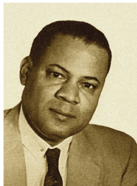
Guy Tirolien (1917-1988)

Así comienza la plegaria de este niño negro, cuya identidad o contexto familiar, social o económico no se precisa en el poema, pero que poco importa, puesto que puede constituir el retrato de cualquier niño negro de la época. Evidentemente, el cansancio al que el niño se refiere es la fatiga del peso de la historia sobre los hombros de su raza. El peso de tantos años de