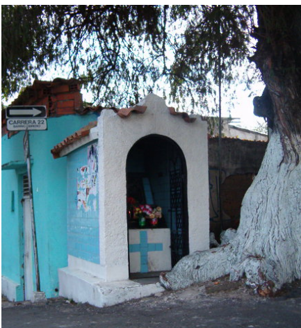
Capilla de los ahorcados