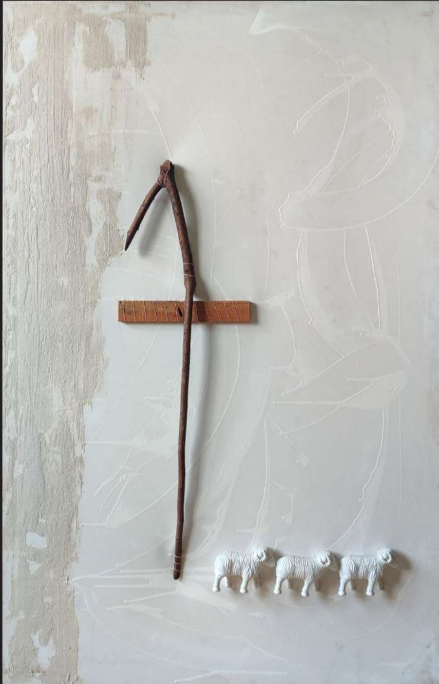
Ave La Casa - La puerta principal 2005 pintura-ensamblaje / lienzo 160 x 100 x 6 cm