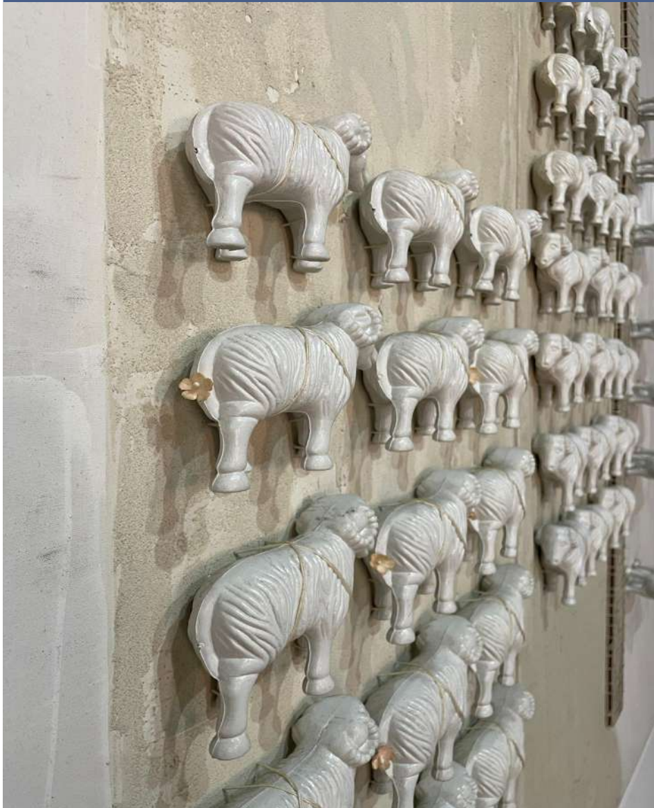
Ave Muro Euclídeo y Calle Real (detalle) / 2005 pintura-ensamblaje / lienzo 160 x 200 x 10 cm