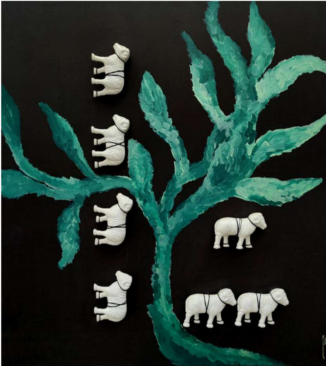
Ave Los maderos de la vida 2005 pintura-ensamblaje / lienzo 110 x 100 x 6 cm