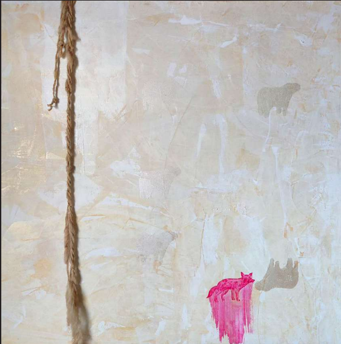
Ave Idéntica identidad 2009 pintura-ensamblaje / lienzo 100 x 100 cm