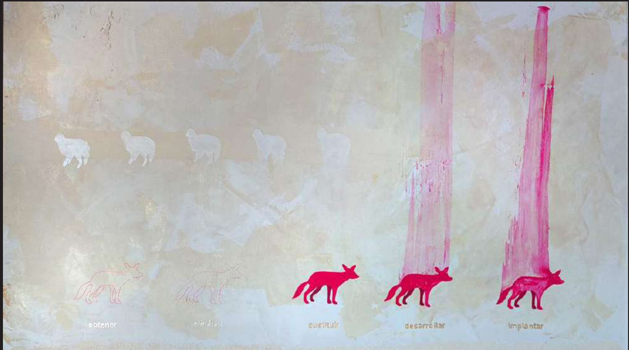
Ave Manipulación 2009 acrílicos / lienzo 54 x 102 cm