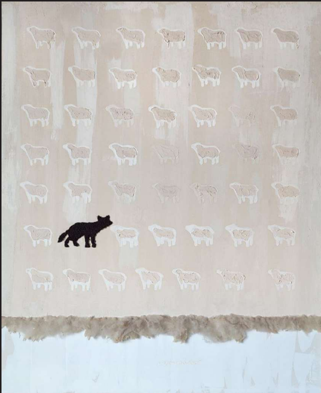
Ave ¿Comen-sales? 2012 mixta / lienzo 100 x 80 cm