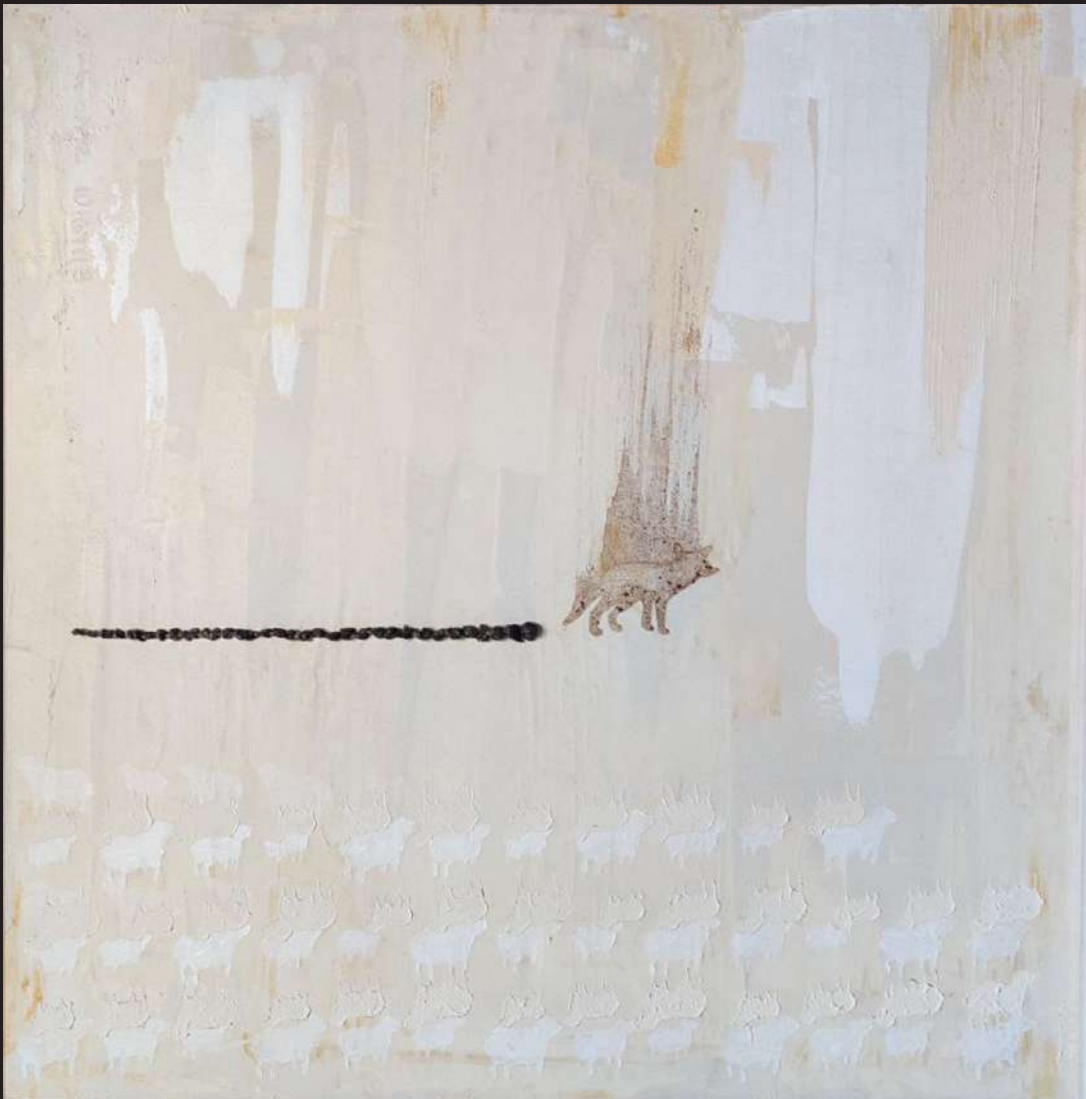
Ave 37 2009 mixta / lienzo 100 x 100 cm