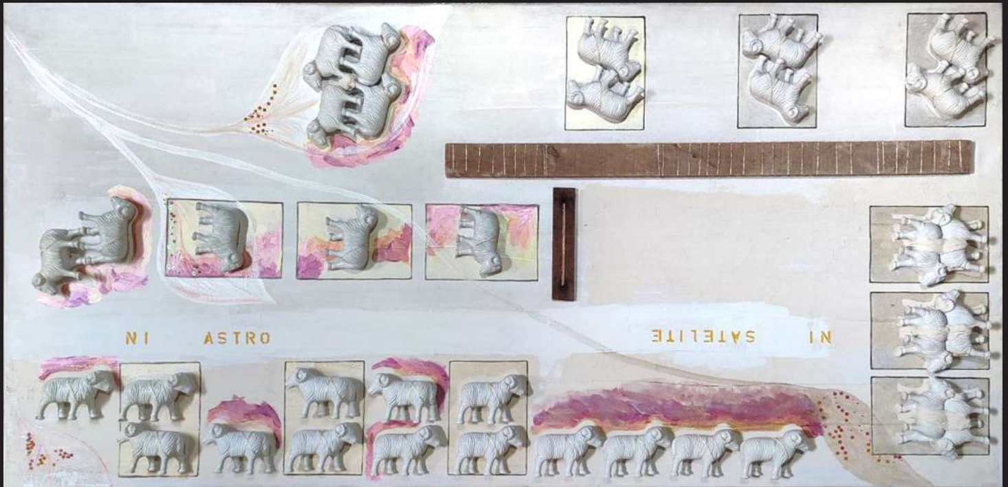
Ave La plaza o una oscura genealogía 2005 pintura-ensamblaje / lienzo 100 x 200 x 6 cm