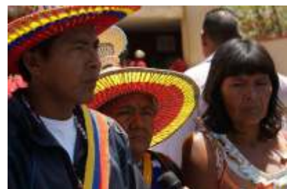
Yukpa Machiques Perijá

(La Constitución de la República Bolivariana de Venezuela, 1999: 66) en su artículo, 119 El estado reconocerá la existencia de los pueblos y comunidades indígenas, su organización política y económica, hábitat y derechos originarios sobre las tierras que ancestral y tradicionalmente ocupan. Por lo que el ejecutivo nacional debe trabajar de maneara mancomunada junto los pueblos indígenas para llevar a cabo su propia Autodemarcación, así como también garantizar el derecho a la propiedad colectiva de sus tierras, que son inalienables, imprescriptibles, inembargables e intransferibles de acuerdo con lo establecido en esta constitución y en la ley.