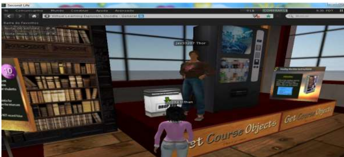
Figura N° 4. Búsqueda de los objetos de un curso en la sala de Slodde en Second Life Fuente Requena, Fombona (2011)