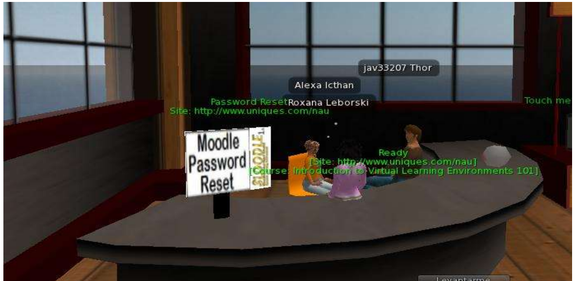
Figura N° 1. Reunión inmersiva. Sala Sloodle en Second Life. Fuente Requena, Fombona (2011)