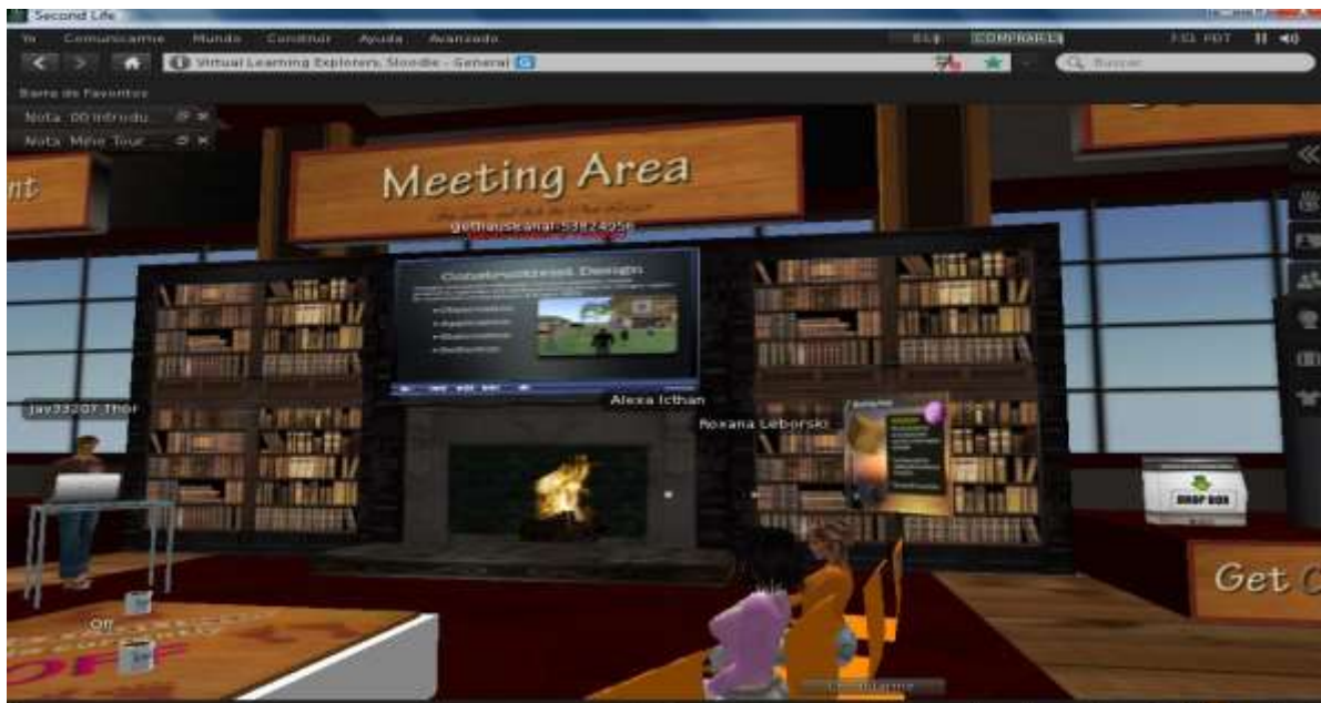
Figura N°2. Uso de videos en clase. Salón de reunión en Second life

Otras actividades pueden permitir una estrecha colaboración entre los participantes como la selección de un curso, la toma e intercambio de sus objetos, y el descubrimiento en conjunto del significado de instrucciones y conceptos. (Figura N° 3, y Figura N° 4).