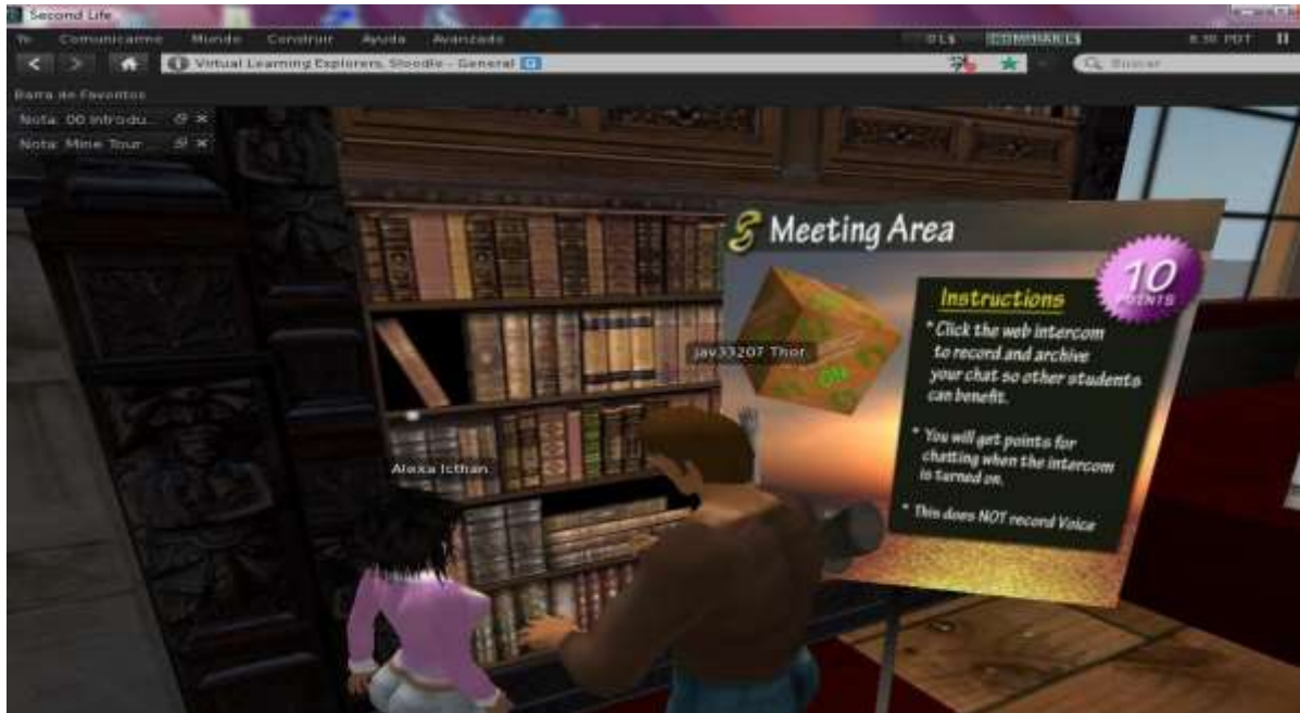
Figura N° 3. Selección de cursos en sala de Slodde en Second Life Fuente Requena, Fombona (2011)