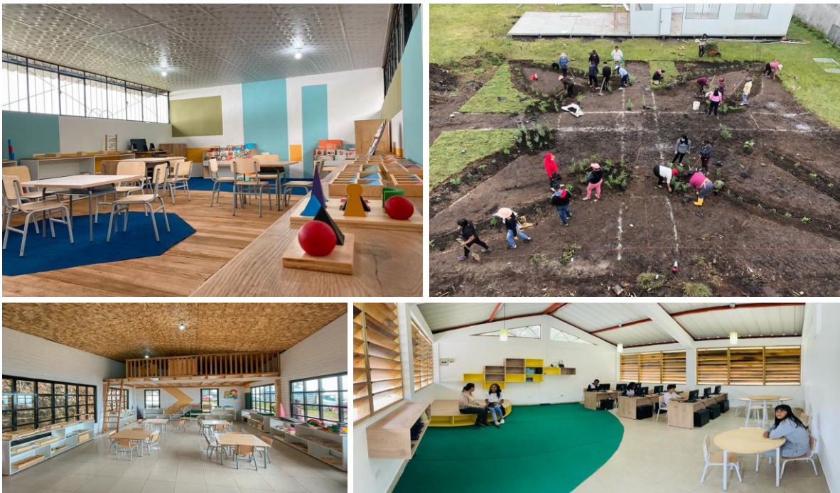
FIGURA 2. Vista de los espacios de algunas escuelas bajo el modelo ChanGo.

El proceso de transformación de las Escuelas Chango se basa en la colaboración activa de la comunidad, incluyendo padres, madres, docentes, estudiantes y líderes comunitarios, quienes participan activamente en los Talleres de Co-creación, donde todos y todas tienen la oportunidad de expresar sus opiniones, compartir ideas y colaborar en la propuesta de intervención de la escuela. Esto permite crear un entorno de aprendizaje que facilite la implementación de la propuesta educativa teniendo en cuenta las necesidades y expectativas de la comunidad, así como las particularidades del contexto social, geográfico y climático.