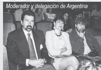
Moderador y delegación de Argentina