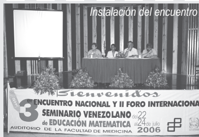
Instalación del encuentro