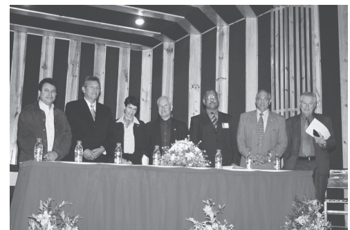
Directiva e invitados especiales