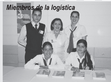
Miembros de la logística

dientes en sus construcciones volitivas y afectivas. Desde esta perspectiva de análisis, el docente opera, sin quererlo, como victimario escolar, siendo más bien una víctima del paradigma predominante.