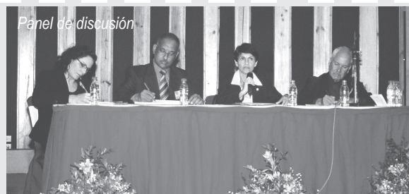
Panel de discusión