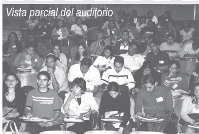
Vista parcial del auditorio