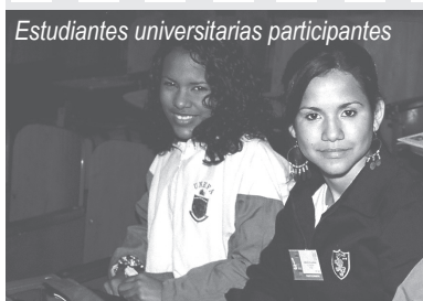
Estudiantes universitarias participantes

El Seminario Venezolano de Educación Matemática (Sveduma) es justamente eso, un encuentro y un foro de búsquedas de interrogantes, no de respuestas ni de soluciones particulares. Se podría concluir que esta edición tercera de su encuentro nacional creció institucionalmente al poderse reconceptualizar su campo de reflexión y los puntos referenciales, fundacionales que dieron origen a este espacio para el encuentro, el diálogo, y el disentir, también necesario y fertilizador por sus desencuentros.