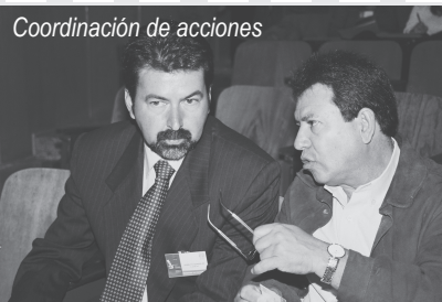
Coordinación de acciones