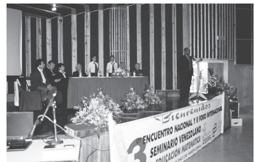
Instalación del encuentro

El receso docente universitario que se iniciaba en esas fechas, dando paso al descanso y a la solaz recreación de la comunidad ulandina, nunca fue un obstáculo para realizar el encuentro y el foro del Seminario, sino un motivo más para celebrar en una universidad abierta, junto a los 296 participantes, la reafirmación y el deseo de contar con una Educación Matemática conducida y orientada por unas coordenadas epistemológicas y pedagógicas que reconozcan la diversidad de aprendizajes que definen un grupo escolar de sujetos aprendientes, sus contextos socioculturales, sus códigos, saberes matemáticos previos y el valor de significar más que informar, construir más que oír.