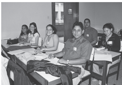
Actividades de un taller

Asimismo, resulta de interés señalar que este Seminario se ha convertido en una instancia promotora de acuerdos institucionales entre la Escuela de Educación de la ULA y el Núcleo de Investigaciones de Educación Matemática Dr. "Emilio Medina" del Instituto Pedagógico de Maracay, UPEL, tendiente a crear el Doctorado en Educación Matemática, en una alianza estratégica y de acuerdos institucionales, donde las universidades del país también son invitadas.