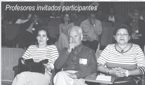
Profesores invitados participantes