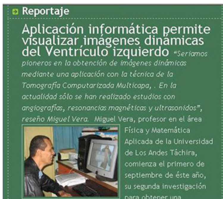
Imagen 1: Ciberbitácora Tecnobideas

añadieron información adicional a la asignada en la cátedra (texto). Ningún estudiante escribió comentarios en la ciberbitácora de sus compañeros, aún cuando en la encuesta reconocen la importancia de la interactividad en los medios digitales, representando una nula interactividad en la comunidad.