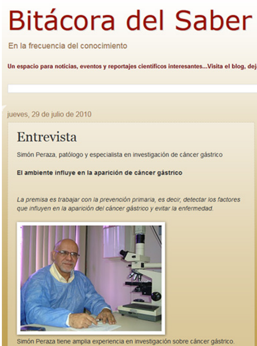
Imagen 3: Ciberbitácora Bitácora del Saber

En la imagen 3 se aprecia la organización por géneros periodísticos de algunas de las ciberbitácoras. En este caso, destaca la entrevista con antetítulo, título y sumario (estructura de los géneros periodísticos).