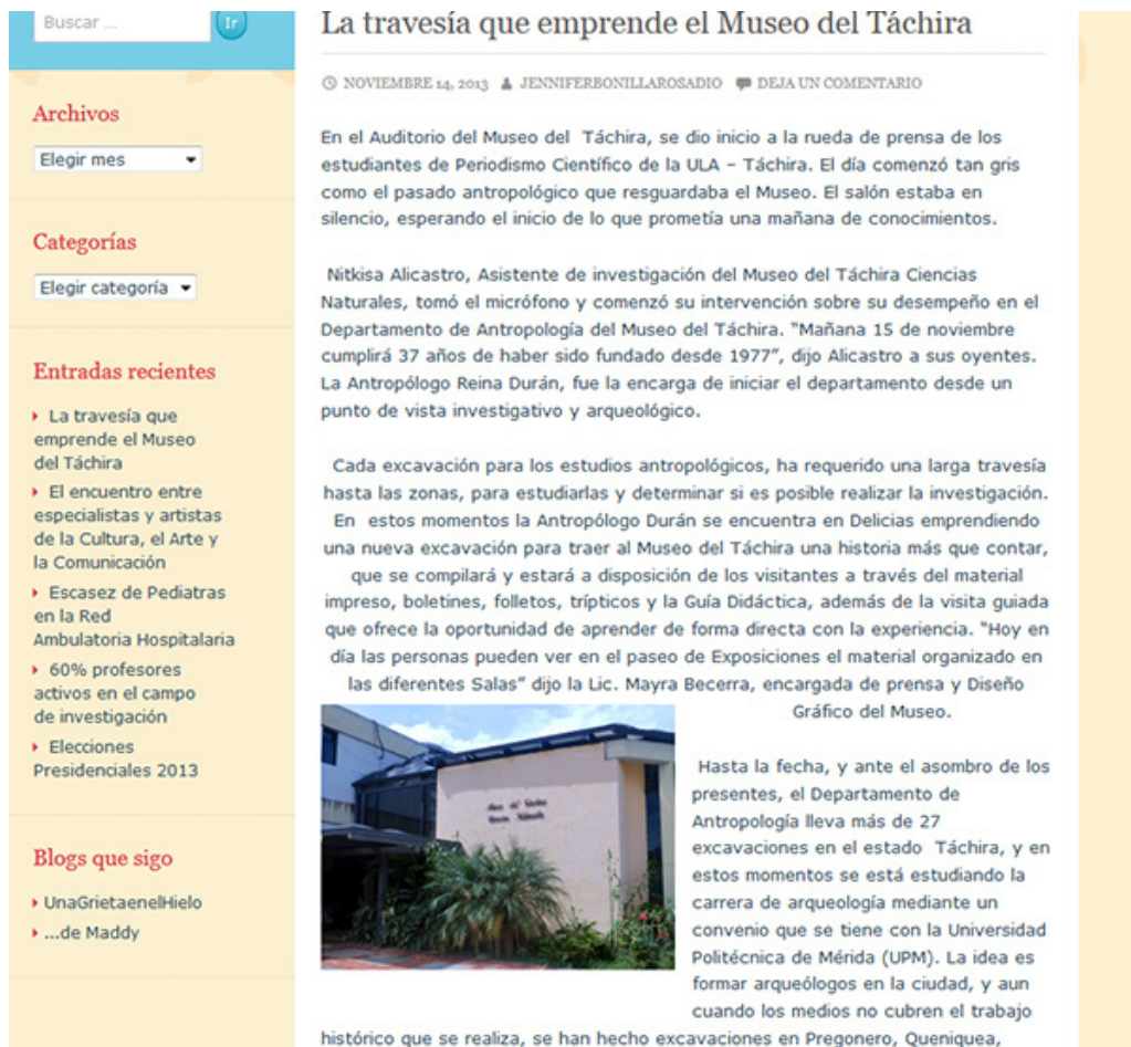
Imagen 6: Ciberbitácora Jenniferbonilla

Herly Alejandra Quiñónez Gómez - Enseñanza de la escritura digital: aspectos formativos para el periodismo científico