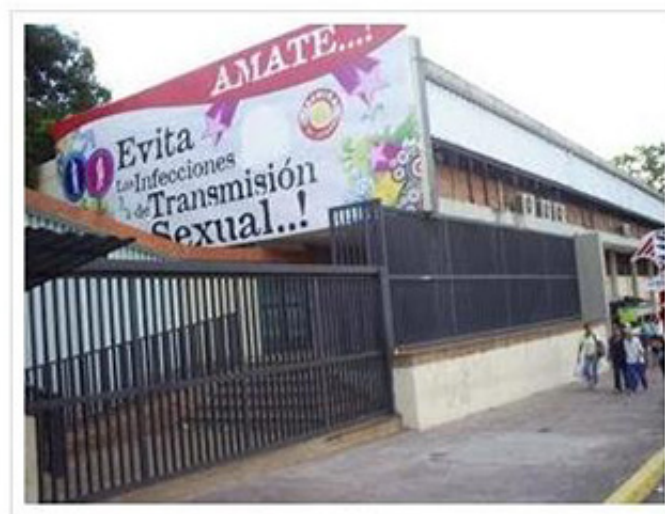
Imagen 2: Ciberbitácora Portal Medeco