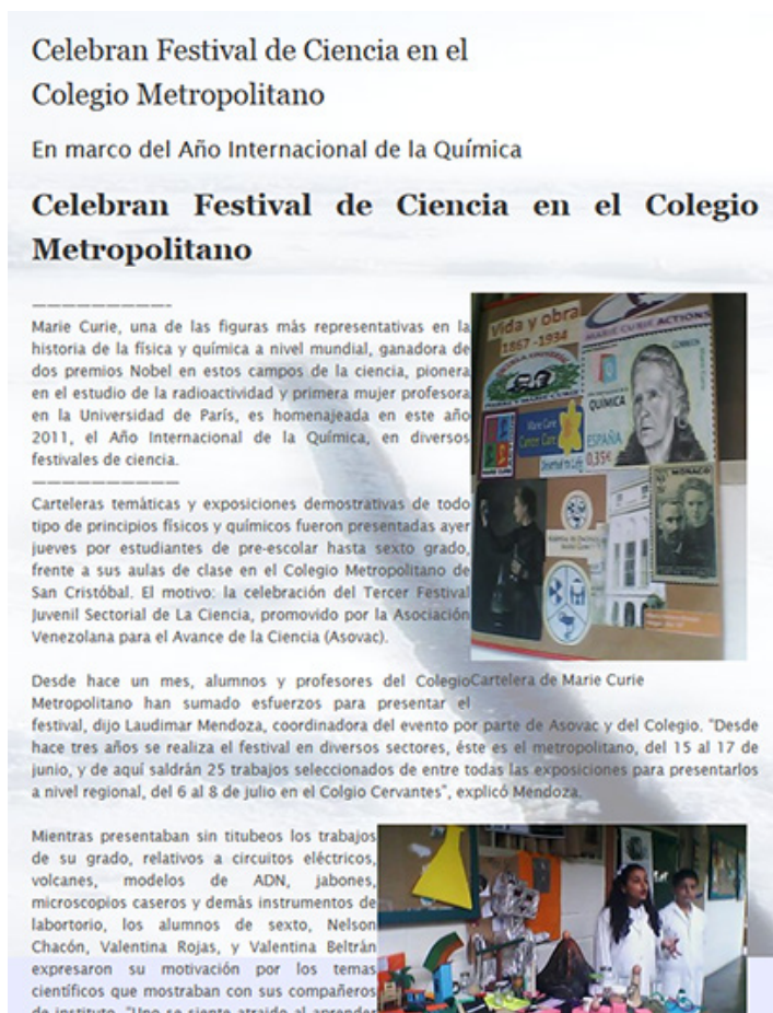
Imagen 4: Ciberbitácora Una grieta en el hielo

En la imagen 4 se observa una noticia sobre un evento científico regional y el diseño periodístico del texto y la fotografía.