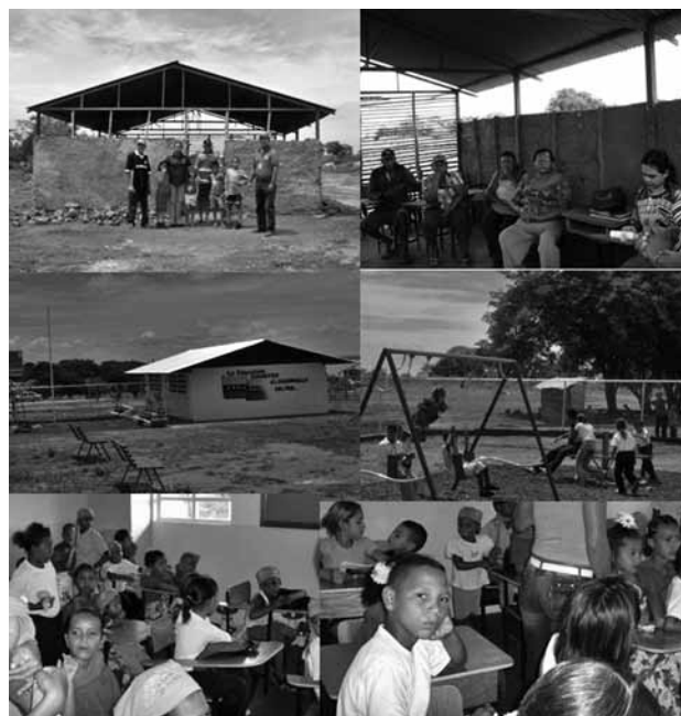
Secuencia 5. Fotografía evidencia el antes y ahora de la escuela.

siguiente mobiliario (UNEG): 2 mesitas en forma de hexágono adecuadas para los niños de pre-escolar y 12 sillas, más, 30 mesas y 30 sillas para la primera y segunda etapa. Este proceso permitió evidenciar en la comunidad que de la participación y unión de esfuerzos entre todos y con un objetivo claro se logran beneficios para la comunidad en general. Los niños, niñas y los maestros contaron para el año escolar 2007-2008 con una infraestructura digna para adelantar un proceso educativo de calidad y pertinencia. La siguiente secuencia 5 de fotografía evidencia el antes y ahora de la escuela.