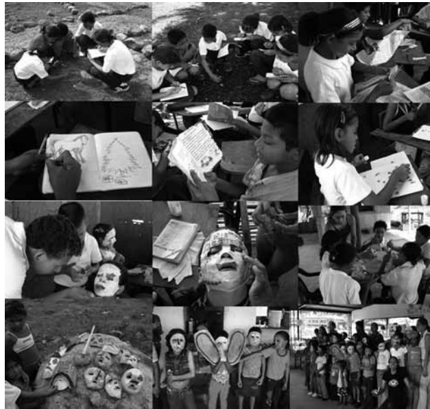
Secuencia 1. Actividades en la escuela Los Negritos: Parcelita de Observación. Coloreando. Rasgando. Haciendo mascarar y celebrando el carnaval en Las Galderas.

Parcelita de observación en el patio de la Escuela (Arago, et al., 2002); lectura libre (diferentes textos de cuentos infantiles); colorear letras; escribir palabras y frases; recortar, rasgar y pegar; representar figuras geométricas con un hilo; realizar ejercicios de motricidad fina (óvalos, círculos y trazos continuos); elaborar mascarar en la cara de su compañero. La siguiente secuencia 1 de fotografías, dan evidencia de las actividades realizadas: