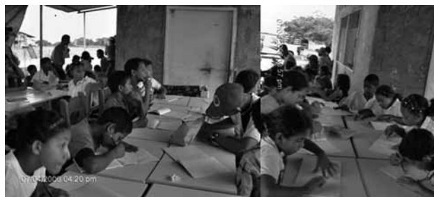
Secuencia 4. Fotografías evidencia las actividades realizada en el taller de dibujo.

estos pequeños y sólo se logrará si sus maestros asumen que el proceso que ellos requieren, está asociado a romper los esquemas “tradicionales” de la copia (generalmente sólo lograban escribir el membrete en toda una mañana) y el dictado (éste terminaba en copia de un texto porque el maestro se retiraba por las limitaciones de transporte) aunque no se descartan como acciones que favorecen el aprendizaje, las primeras actividades para estos escolares deben ser motivadoras, interesantes y estar adecuadas a los intereses y necesidades de desde su contexto como la pauta que los puede conectar (Novo, 1998) y no sólo al cumplimiento administrativo de controles por parte del maestro. La siguiente secuencia 4 de fotografías evidencia la actividad realizada.