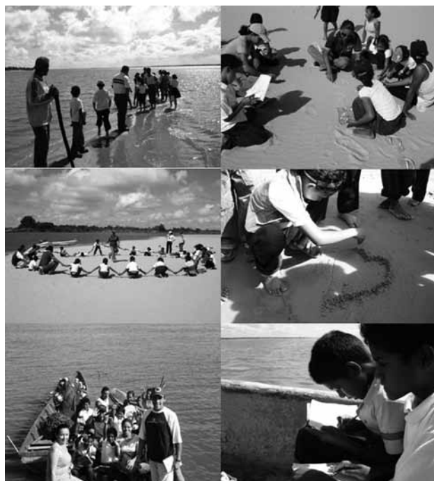
Secuencia 2. Paseo a un banco de arena del Corredor Ribereño del bajo Orinoco.

Un nuevo escenario se presenta en la escuela, finalizando el acompañamiento de las estudiantes de la UNEG, la Directora de los NER 308 incorpora una nueva maestra en la escuela, facilitando la división del grupo de niños y niñas en primera y segunda etapa, aunque permanecen ambos maestros en la misma infraestructura (un solo salón). Se coordina una reunión de trabajo y se presenta lo que se ha desarrollado, observándose interés por parte de la nueva maestra y la misma actitud “neutral” del maestro. Se realizó un primer paseo al centro del canal de navegación del Orinoco, en un Banco de Arena sugerido por los representantes de la comunidad. Todos los participantes de la actividad disfrutaron el recorrido, observándose las expresiones en la siguiente secuencia 2 de fotografías.