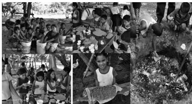
Secuencia 3. Fotografías se evidencia el proceso desarrollado en el taller de arcilla.

elementos del trabajo con arcilla (se elaboró una cartilla educativa), se evidenció el trabajo en equipo, rescatando los valores de cooperativismo y solidaridad, así como hábitos de trabajo. En la siguiente secuencia 3 de fotografías se evidencia el proceso desarrollado.