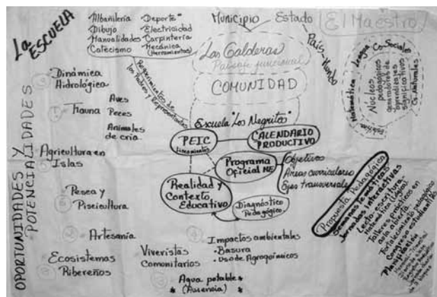
Esquema 3. Red de componentes del perfil de PEIC de la Escuela Los Negritos.

La propuesta pedagógica se traduce en la construcción progresiva del PEIC (Esquema 3), donde se integran teórica y metodológicamente una serie de componentes que definen las interrelaciones y complejidades de la trama educativa en un contexto delimitado, pero no parcelado. Apropiarse de este instrumento desde su dinámica y aristas de aplicación para una praxis pedagógica, ofrece oportunidades para reconstruir un currículo contextualizado desde lo regional y lo local con visión global.