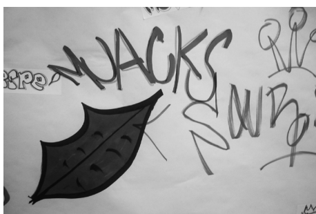
Sobre el mural, realizaban dibujos, plasmaban su firma, incorporaban mensajes a sus compañeros, etc.