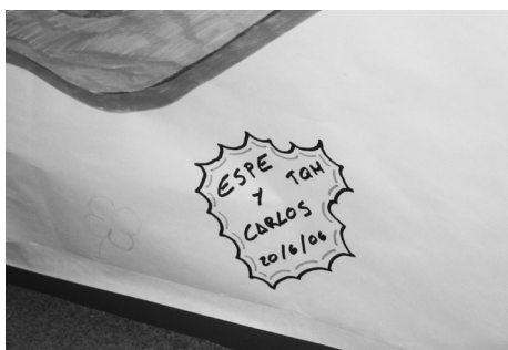
Textos escritos sobre los murales y dibujos que quedaban en el aula tras el taller

Estos procesos de comunicación a través de sus producciones artísticas, ya la habíamos recogido en talleres anteriores, donde los chicos utilizaban soportes como los murales, o los “post-it”, para dejarse mensajes entre ellos o incluso para “lanzar” mensajes al exterior. Muchas de estas expresiones artísticas se realizaban a posteriori del taller pero aprovechando los medios que el taller les había facilitado.