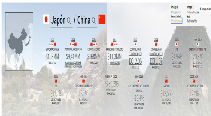
FIGURA I COMPARACIÓN ENTRE JAPÓN Y CHINA EN TÉRMINOS DE EXPORTACIONES, PIB E ÍNDICE DE COMPLEJIDAD ECONÓMICA EN EL 2021