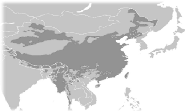
Mapa del área lingüística de la familia sino-tibetana El color más oscuro marca el área lingüística de la familia sino-tibetana

De esta forma, el grupo de lenguas tibeto-birmanas forma parte de la gran familia de lenguas sino-tibetanas que se puede comparar, en tamaño y diversidad, con la familia indo-europea. Además de las lenguas tibeto-birmanas, la familia sino-tibetana incluye las lenguas karen y mandarín. A excepción del birmano, el tibetano es completamente diferente en términos de sintaxis y vocabulario a la mayoría de los idiomas de la región: el mandarín, el hindi, el nepalés, las lenguas turcas y las mongolas. (Tournadre, 2003: 25)