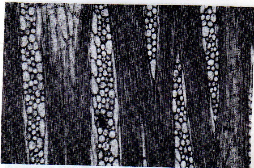
Foto No. 3: Cordia thaisiana Agostini. Radios mayores de 1 mm de altura, con células envolventes.