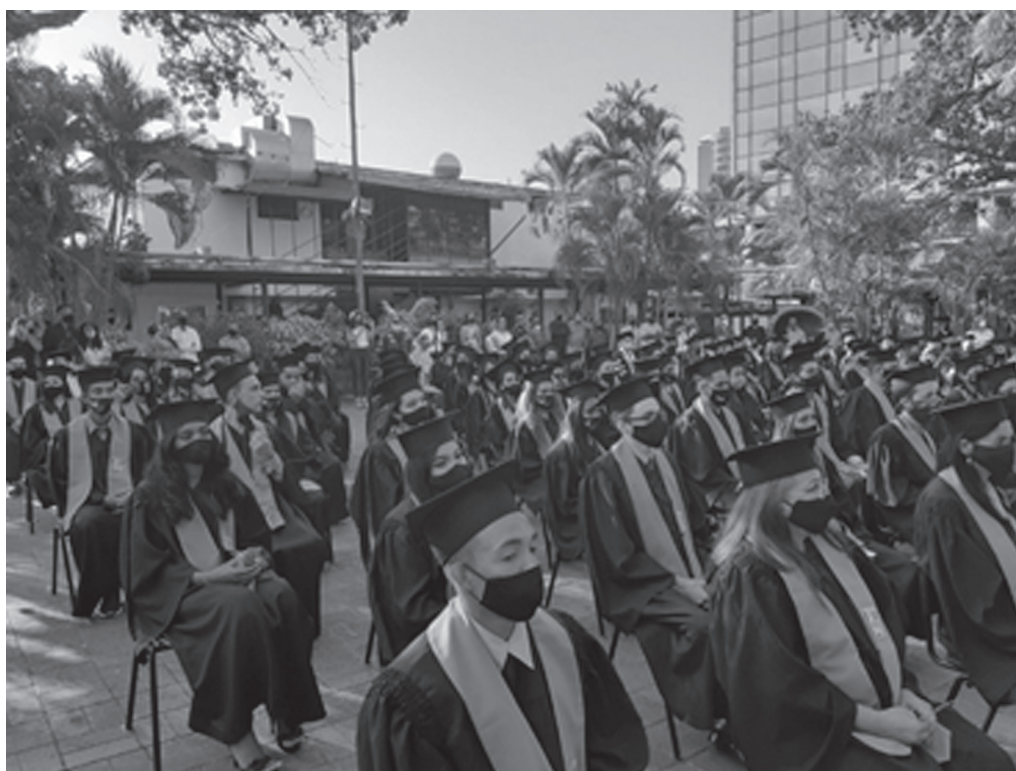
Acto de Grado. Facultad de Ciencias de la Educación -Universidad de Carabobo (febrero 2020)

Otro aspecto reconocible en las IES es la actuación del enfoque del neoinstitucionalismo como refiere Barba (2019): “Las organizaciones son sistemas abiertos influenciados por las fuerzas del medio ambiente sociales y culturales, más que fuerzas racionales orientadas a alcanzar la eficiencia” (p. 151). Los cambios organizacionales ocasionados a las IES por la pandemia COVID-19, muestran que están conformadas por unos individuos resilientes con sentido de pertenencia y compromiso con la sociedad, unido a una cultura organizacional dentro de las IES, estas son las fuerzas que les han conducido al logro de los objetivos dentro de la organización, alcanzando egresos de nuevos profesionales venezolanos que fueron estudiantes dentro de las aulas virtuales creadas a partir del 15 de Marzo 2019, cuando se hizo el llamado a cuarentena radical por la pandemia, evento que no se esperaba llegara a Venezuela.