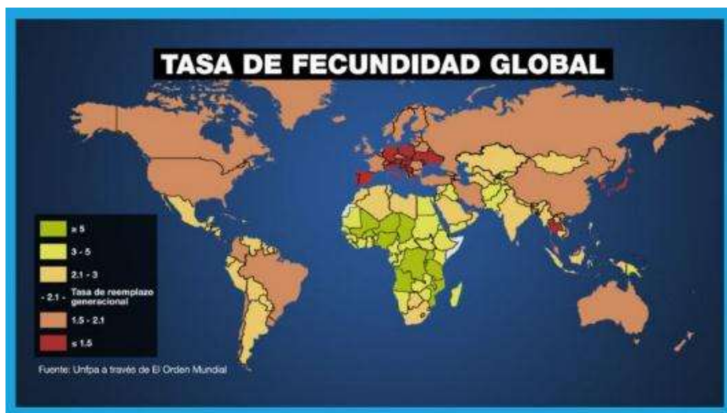
Gráfico N° 2. Tasa de fecundidad global.

Otro importante desafío de cara al futuro en varios países, es el denominado envejecimiento demográfico, a pesar de que en las próximas décadas muchos países, del África sobre todo, experimentarían altas tasas de población económicamente activa (PEA), en otros la tendencia es el envejecimiento poblacional, con aumentos en la tasa de dependencia. De una forma concisa, el envejecimiento de la población es cuando en un país el número de adultos mayores (más de 60 años) crece y, a su vez, hay una reducción proporcional de niños (hasta la edad de 15 años), aunado a ello la fuerza laboral (personas de 15 a 59 años) disminuye proporcionalmente. Los datos que maneja el UNFPA indican que la proporción de la población mundial de 65 años o más aumentará del 10 %, en 2022, al 16 % en 2050. Para este último año, se espera que el número de personas mayores de 65 años en el mundo duplique al número de niños menores de 5 años, y llegue a igualar la población de