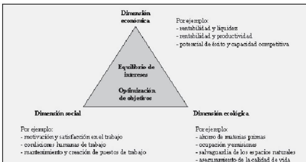
Figura 2. >>> Las dimensiones de la empresa.

constituirse como un elemento competitivo en sus organizaciones, por lo tanto, las mismas deben contemplar en sus objetivos además de la dimensión económica y social, la ecológica (Figura 2), proporcionando esta última dimensión una ventaja competitiva vía mejora de la productividad o la diferenciación.